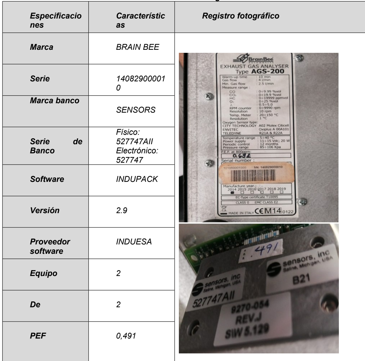
Tabla 3. Identificación de analizador de gases – Ciclo Otto - 2

Fuente: Programa CDA – Fuentes móviles junio 2023